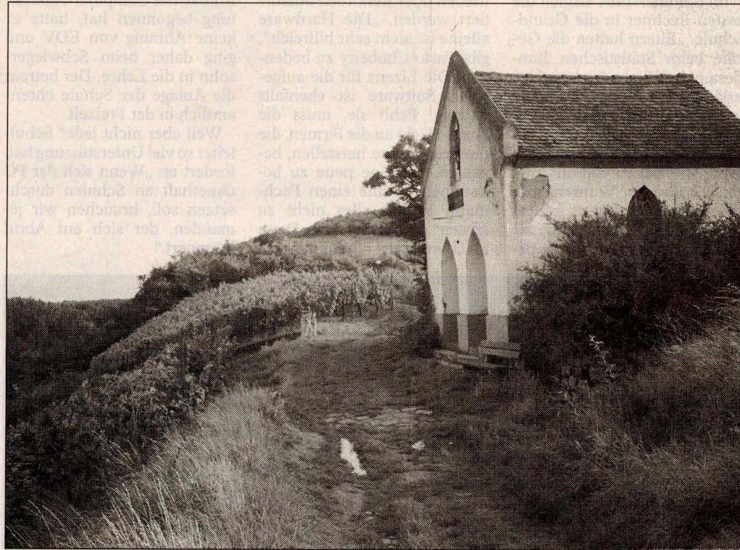
Faszinierende Ausblicke und viel Information über den Weinbau bietet die Wanderung über den „Buttemännchenweg“. Unser Bild entstand an der Dreifaltigkeitskapelle

Der „Buttenmännchen-Weg“ wird am Hang von einem rund ein Kilometer langen schmalen Naturschutzgebiet begleitet. Die Niersteiner Kilianskirche grüßt aus der Ferne und der Flusslauf kann über mehrere Kilometer verfolgt werden.